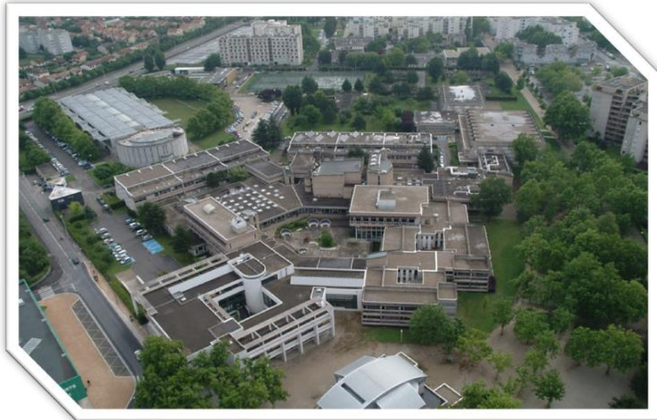
Campus de Vaulx-en-Velin